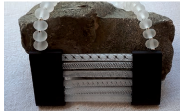
Mea Brunhilde Übler